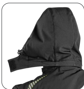
odepínací kapuce detachable hood odpinany kaptur