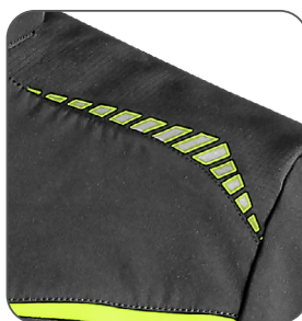
reflexní doplňky reflective accessories elementy odblaskowe