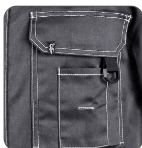
multifunkční kapsy multifunctional pockets kieszenie wielofunkcyjne