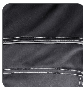
reflexní doplňky reflective accessories elementy odblaskowe