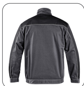
zadní strana back side z tyłu